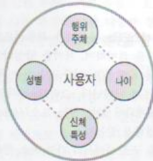
그림 6. 정황 분류_사용자

같은 인구 통계학적 정보를 비롯해 신체 특성, 거주 지역, 거주 형태, 가족 내 역할, 행위의 주체 유부 등 상황에 따라 변하는 요소로 분류할 수 있다. 이에 대한 분류가 그림 6에 있고 내용은 표 1에 나타나 있다. 사용자들 중심으로 다른 정황 요소와의 관계를 분석하면 다양한 사용자 케이스를 확보할 수 있고 또한 사용자마다의 정황의 차이를 통해 사용자 모델링이 가능하다. 그러나 복잡도가 높아져 일반화, 객관화하기가 어렵다. 따라서, 사용자는 자료 자체 변수에 포함되지 않았다.