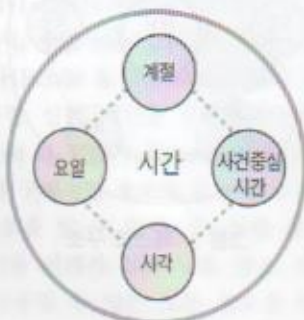
그림 7. 정황 분류_시간

로 정의하였다. 절대적인 시간은 계절, 요일, 시각으로 모든 사용자에게 동일하게 적용할 수 있는 기준을 의미하며, 상대적 시간은 사용자들마다 인지하고 있는 기준이 다른 분류 기준을 의미한다 [표 2].