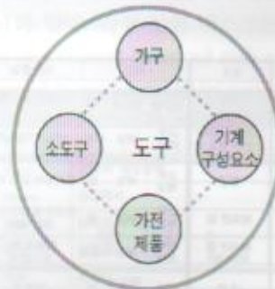
그림 8. 정황 분류_도구

도구는 그 특성에 따라 불박이 가구 및 창문, 방판 등과 같은 가구(furniture), 가정용 기기와 시스템을 가지고 있는 도구를 가전제품(home appliance), 가구나 가정용 기구나 가전제품에 부착되어 있는 개개의 요소를 기계 구성요소(component), 사용이 어딘 장소에 국한되지 않으며 시스템을 갖지 않는 도구를 소도구(gadget)으로 분류한다. 도구에 대한 정황 분류가 그림 8에 나타나 있고, 도구에 대한 요소 분류를 정리한 것이 표 3에 있다.