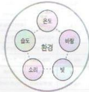
그림 10. 정황 분류_환경