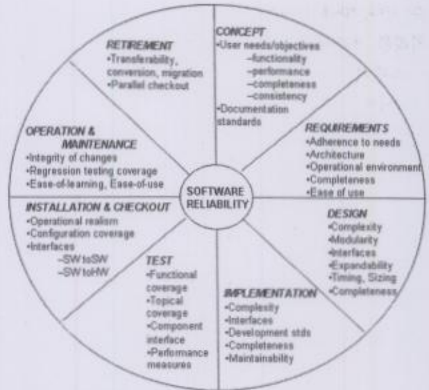
그림 2. 신뢰성에 영향을 주는 품질 요소[7] Fig. 2. Elements that affect the quality of Reliability

IEEE std 989.2는 신뢰성 있는 소프트웨어 프로세스 측정을 위한 개념과 동기를 제공하고 있다. 또한, 프로젝트에서 적용하기 위해 IEEE std 982.2-1988에서는 소프트웨어 라이프사이클을 통해 제품과 프로세스에 적용, 지속적인 자기 평가와 신뢰성 향상을 위한 수단, 신뢰성 있는 소프트웨어 개발의 최적화 방법, 비용과 시간의 압박을 예상하여 초기 개발단계에서 시작, 운영과 유지보수 동안의 실제 사용 환경에서 소프트웨어 신뢰성을 최대화 하는 방법, 신뢰성 관리를 위한 수단 개발 등에 대한 정보들을 제공한다[7].