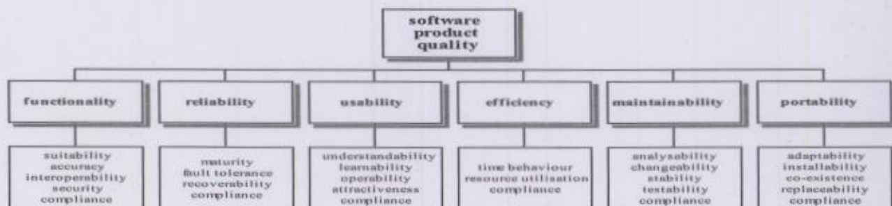
그림 1. ISO/IEC 9126 구조[2]